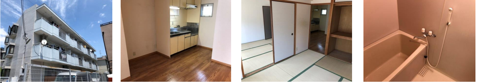
ファーストプレイス園田外観 ダイニングキッチン 和室 浴室