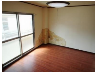
アクセントクロス