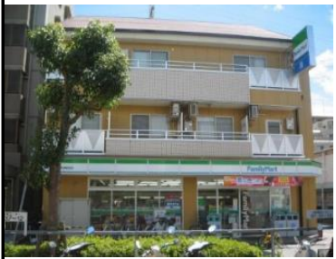
猪名寺ツーワンビル外観